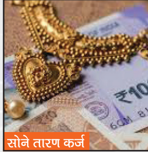
सोने तारण कर्ज